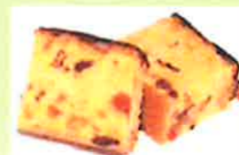
フルーツケーキ (イチ)