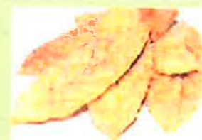
杜のミルフェ (バラ) / (10枚)