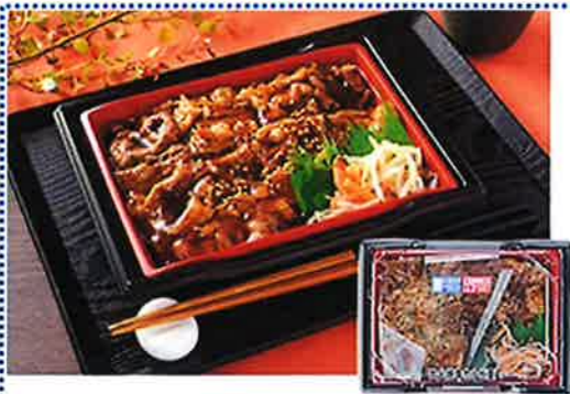
炭火焼牛カルビ重