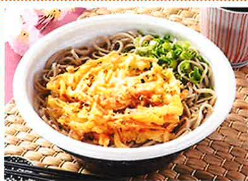
桜海老のかき揚げそば