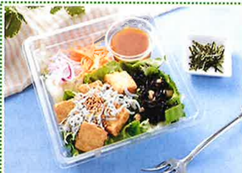
厚揚げと釜揚げしらすのサラダ