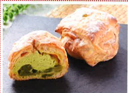
抹茶あん&ホイップの和風パイシュー