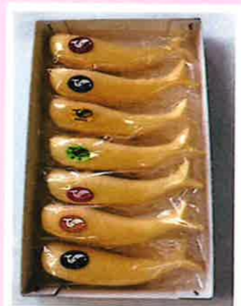
くじらもなか 7個入 ¥1,500