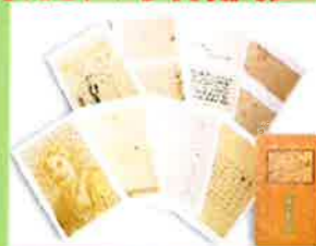
漱石絵葉書セット(8枚組) 500円