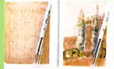
漱石ボールペン付絵葉書 各350円