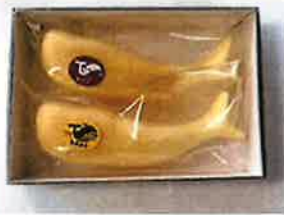
くじらもなか 2個入 ¥500