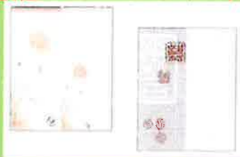
漱石一筆箋(全2種類) 各400円