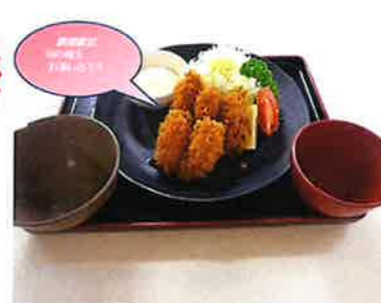
カキフライ定食 850円