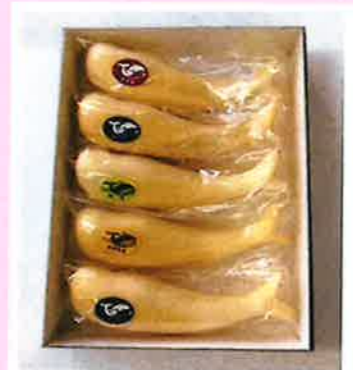
くじらもなか 5個入 ¥1,100