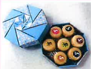
小もなか 7個入 (手作り折紙箱入) ¥800