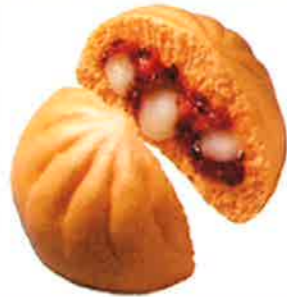
とろーりチーズのピザまん 130円