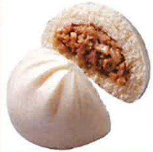
ジューシー肉まん 130円